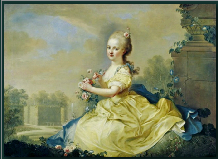
Maria Josepha Hermenegilda